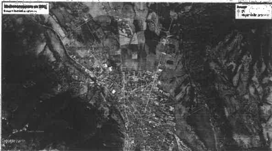
Местоположение на ИП спрямо ЗЗ и ЗТ

ИП не попада в защитена територия по смисъла на Закона за защитените територии, както и в границите на защитени зони (Натура 2000 места). С оглед гореизложеното, отчитайки местоположението и характера на инвестиционното предложение, при реализацията му не се предпоставя отрицателно въздействие върху защитени зони: ЗМ "Речка" намираща се на разстояние 6 км. И BG0000186 ПП "Врачански балкан" на разстояние 1,9 км.